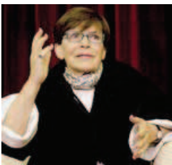
Attesa Franca Valeri in scena il 20 ottobre

Un cartellone attento e sensibile all'oggi per quel piccolo teatro di Niguarda che in attesa di una sede più adeguata invade la cit-